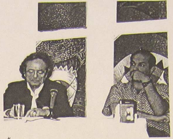
أدونيس في المركز الثقافي العربي السويسري