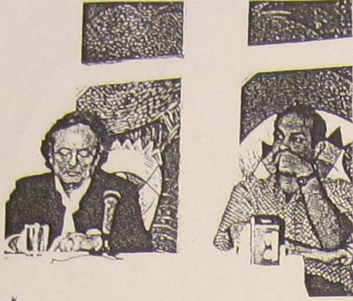
أدونيس في المركز الثقافي العربي السويسري